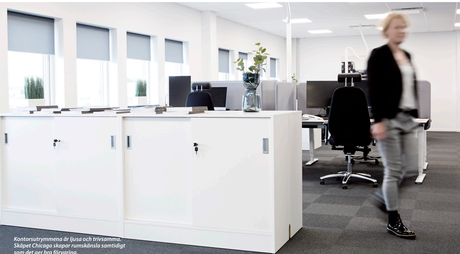
Kontorsutrymmena är ljusa och trivsamma. Skåpet Chicago skapar rumskänsla samtidigt som det ger bra förvaring.