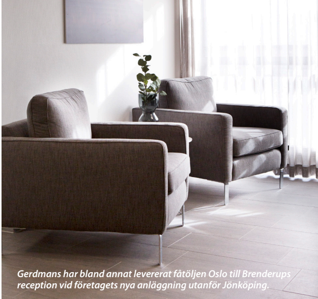
Gerdmans har bland annat levererat fåtöljen Oslo till Brenderups reception vid företagets nya anläggning utanför Jönköping.

kontor och personalrum i den nya anläggningen.