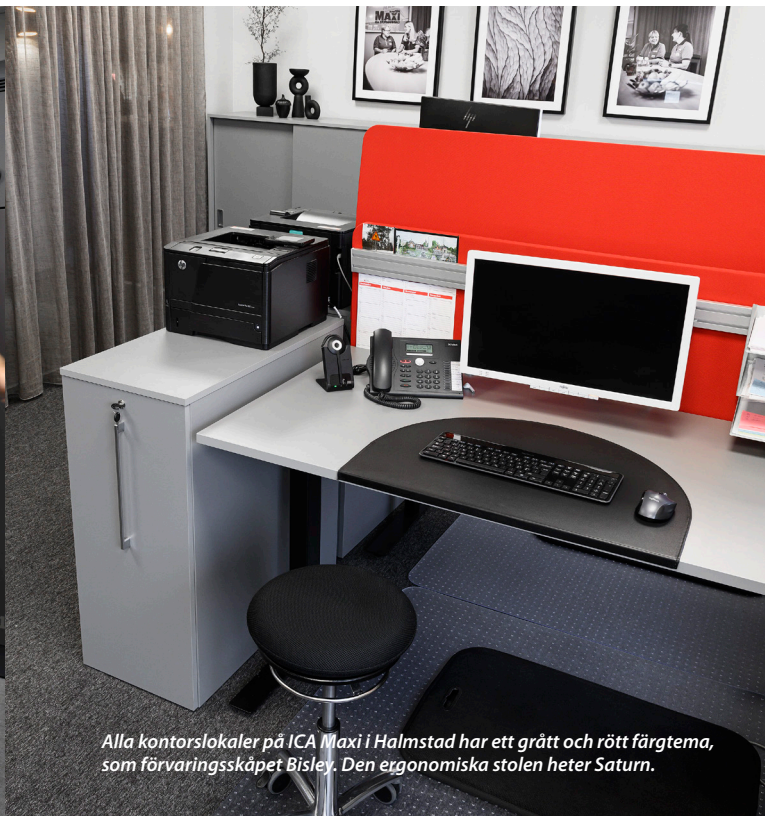
Alla kontorslokaler på ICA Maxi i Halmstad har ett grått och rött färgtema, som förvaringsskåpet Bisley. Den ergonomiska stolen heter Saturn.