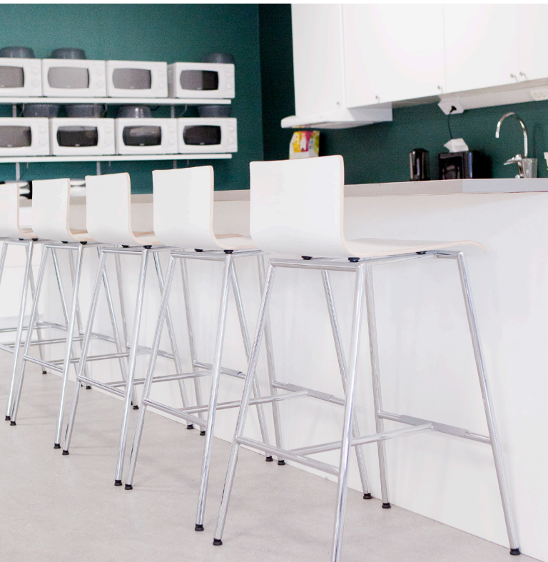
Personalens lunchrum på Brenderup har en stilfull och praktisk inredning. Barstolen heter Zafiro.

– Vid större uppdrag arbetar vi på projektavdelningen med flera olika delar såsom framtagning av förslag och underlag på möbler, kostnadsförslag, beställning, boka in montörer och säkerhetsställa leveransen. Det är viktigt för oss med uppföljning tillsammans med kunden efter att allt är levererat och klart, för att stämma av så att uppdragsgivaren känner sig nöjd. Kunden ska känna sig trygg i processen, att vi hjälper dem att förverkliga deras önskemål, tankar och idéer. Inget projekt är för stort eller för litet, alla våra kunder har tillgång till vår expertis och hjälp hon.