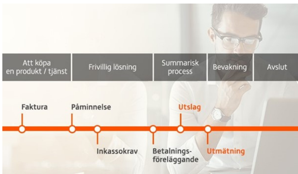
Figuren illustrerar en obetald fakturas olika stadier vid inkassohantering.

Konsumenter och företagskunder: Om fakturan inte betalas trots påminnelsen skickas ett inkassokrav till kunden. Syftet är att kunden ska betala sin skuld eller ta kontakt med Lowell för att nå en överenskommelse som passar alla parter.